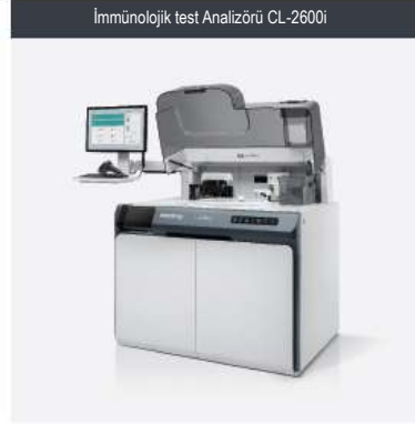
İmmünojenetik test Analizörü CL-2600i