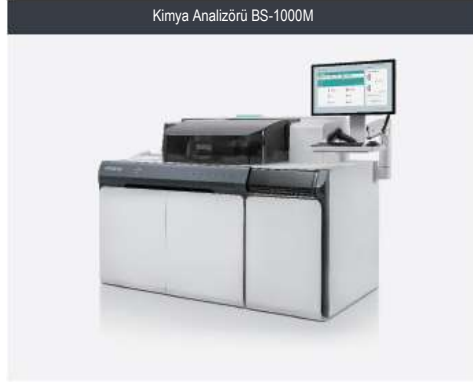
Kimya Analizörü BS-1000M