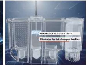
Reaktif kabarcık riskini ortadan kaldırır Eliminates the risk of reagent bubbles